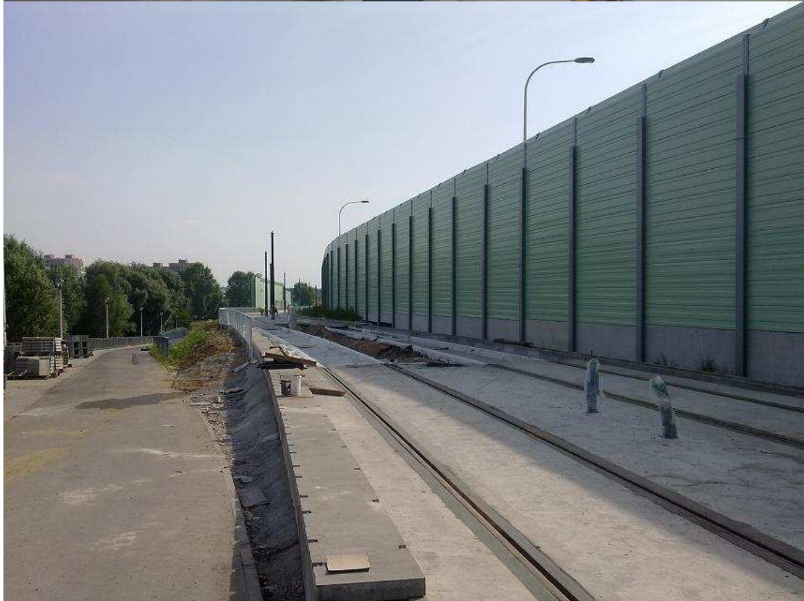
Górne zdjęcie z 30 lipca, dolne z 01 sierpnia