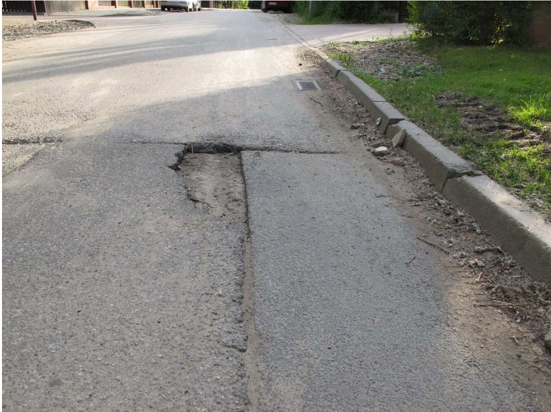
f) brud pobudowlany przy krawężniku,