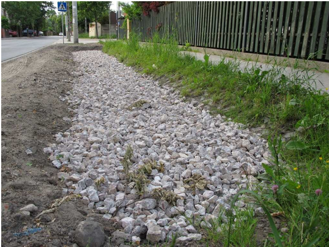
d) pozostawione silne uszkodzenia krawężnika na skłęcie (skrzyżowanie Kiersnowskiego / Fletniowa),