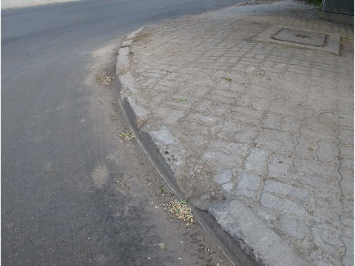
e) uzupełnienie niechlujnie wykonane innym rodzajem kostki w chodniku (po wschodniej stronie ul. Fletniowej, za skrzyżowaniem z Kiersnowskiego),